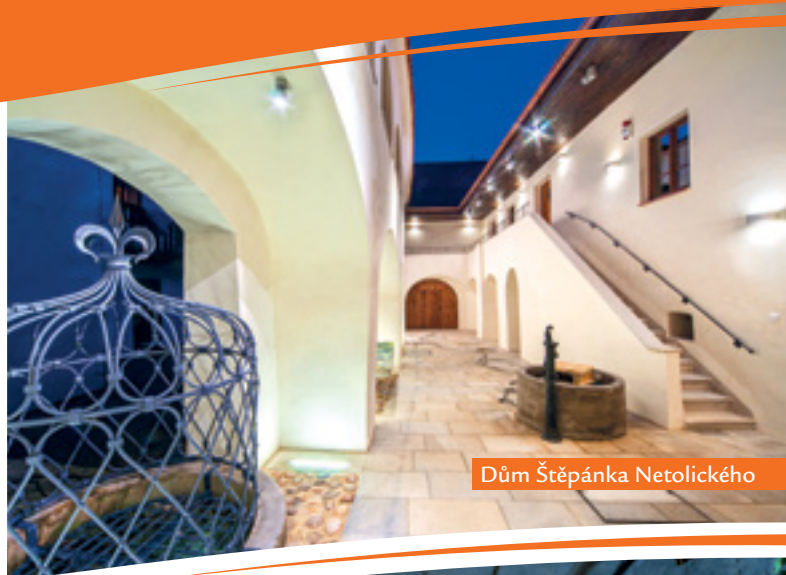
Dům Štěpánka Netolického